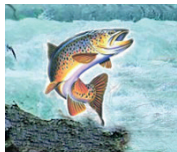
BACINO ASTICO LEOGRA