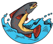
BACINO AGNO CHIAMPO